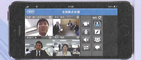
スマートフォン画面